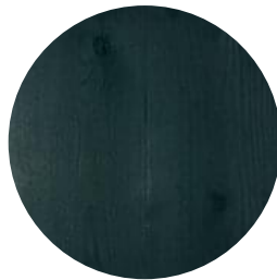
RUBIO MONOCOAT GREEN