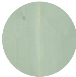
SALT LAKE GREEN