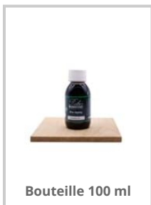
Bouteille 100 ml