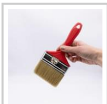
Rubio Monocoat Brush Standard 100