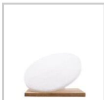
Rubio Monocoat Pad blanc 16 inch