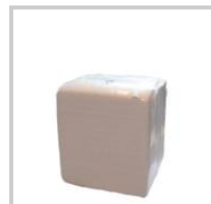
White Wiping Rag - set 10 kg