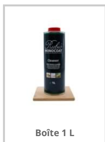
Boîte 1 L