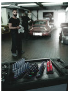
Les sangles porte-outils Wera