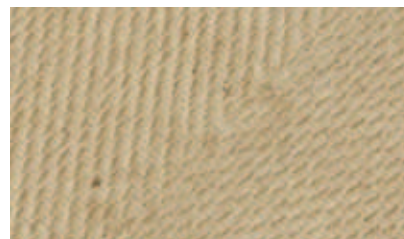
Gestructureerd oppervlak van STEICO top

Bovendien zijn STEICO top platen extreem dampopen. Indien er vocht in de platen dringt, kan dit probleemloos verdampen. Bij andere isolatiematerialen waar het gebruik van een afdekplaat noodzakelijk is, zullen deze afdekplaten de waterdamp afblokken. STEICO top beperkt also het risico op schimmelvorming.