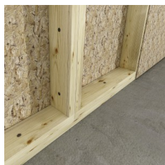
Doublage de montants