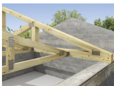
Assemblage des fermettes