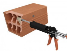
Injecter la résine.