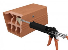
Injecter la résine.