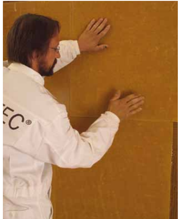
Abbildung 5.3.2: Ansetzen der Lehm-Trockenputzplatten D16 unmittelbar nach Aufziehen des Klebers