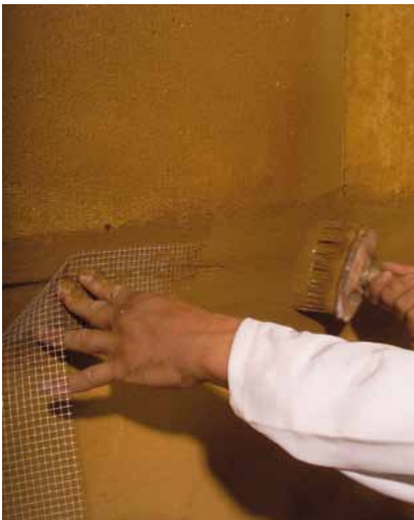
Abbildung 5.3.3: Einarbeiten von Flächen- oder Fugenarmierung (hier Glasgewebe-Fugenarmierung)