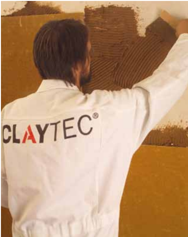
Abbildung 5.3.1: Aufziehen von Lehmkleber mit dem Zahnschachtel auf die vorbereitete Fläche